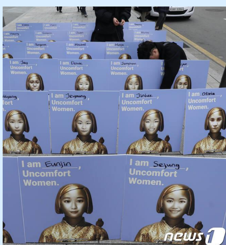
〈 분석 〉