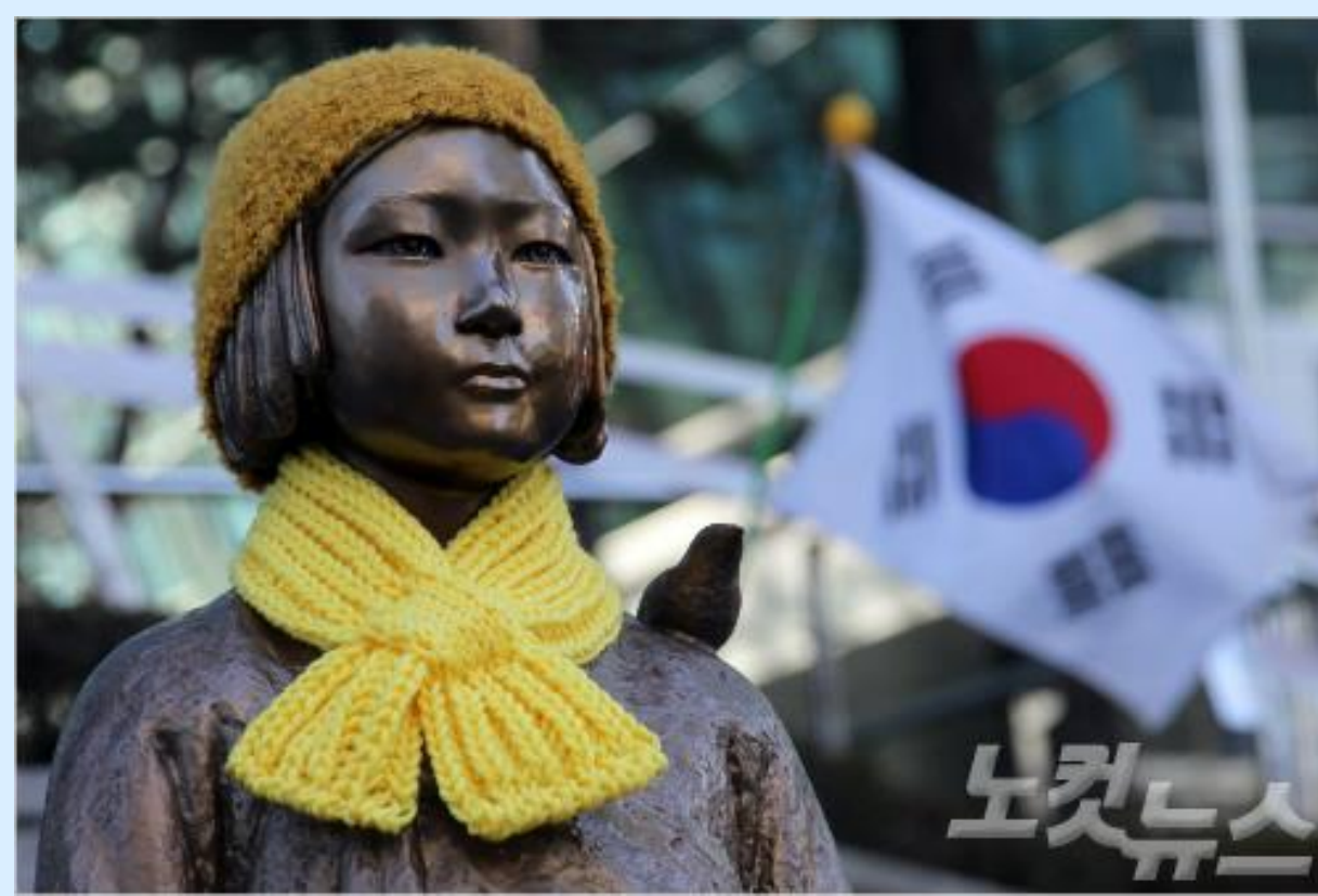
〈 평화의 소녀상 과 "UNCOMFORT WOMEN PROJECT" 〉 〈 소개 〉

일본군 성노예제 문제해결을 위한 정기 수요집회 1000회를 맞이하여 서울 종로구 일본 대사관 앞에 처음 세워진 '평화의 소녀상' 평화비의 모습이다. 일본대사관을 응시하고 있는 모습을 하고 있으며 옆에 작은 의자가 놓여져 있어 일본군 위안부 문제를 되새기는 체험공간이 마련되어 있다. 옆의 사진은 소녀상옆에서 시민들의 얼굴을 소녀상과 합성하는 'UNCOMFORT WOMEN PROJECT'퍼포먼스의 모습이다.