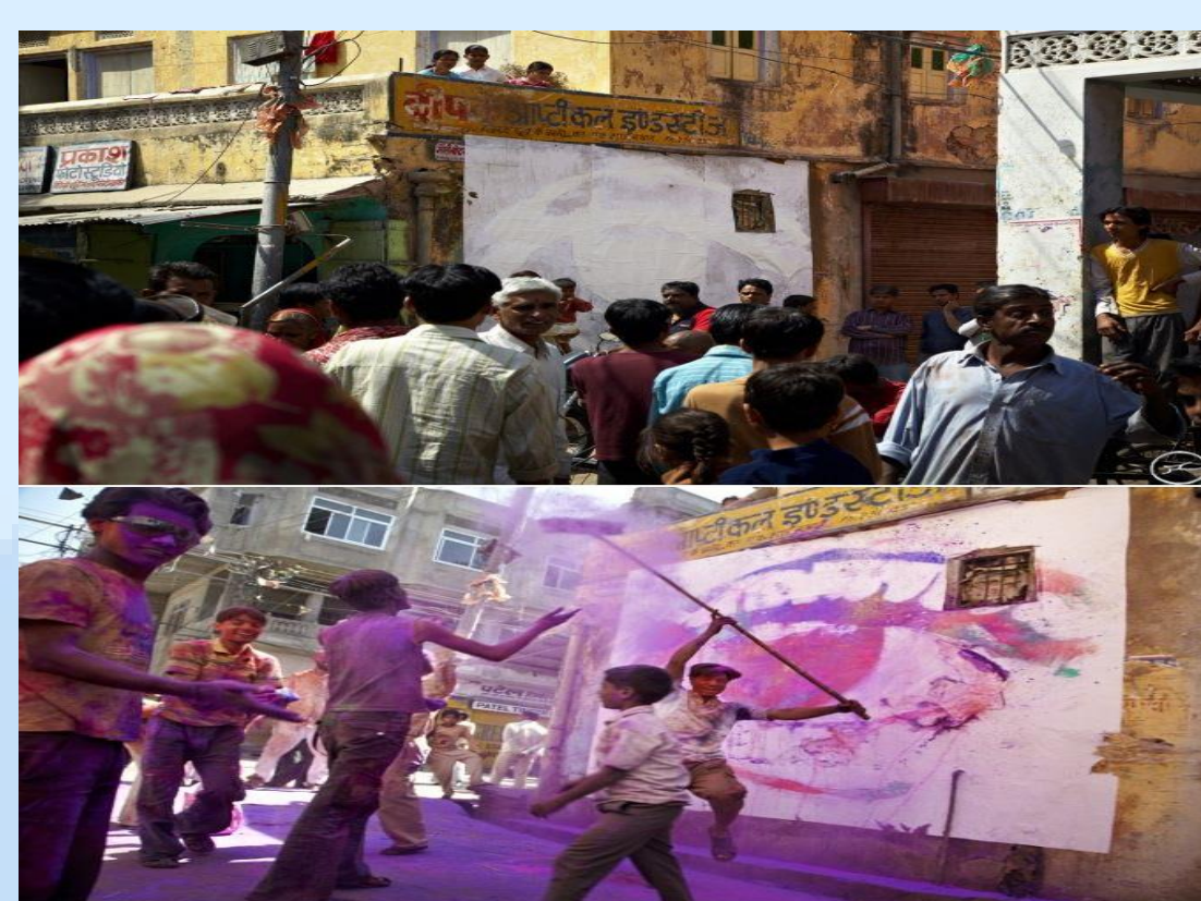
〈 GLOBAL ART PROJECT 中 'WOMEN ARE HEROES' 〉