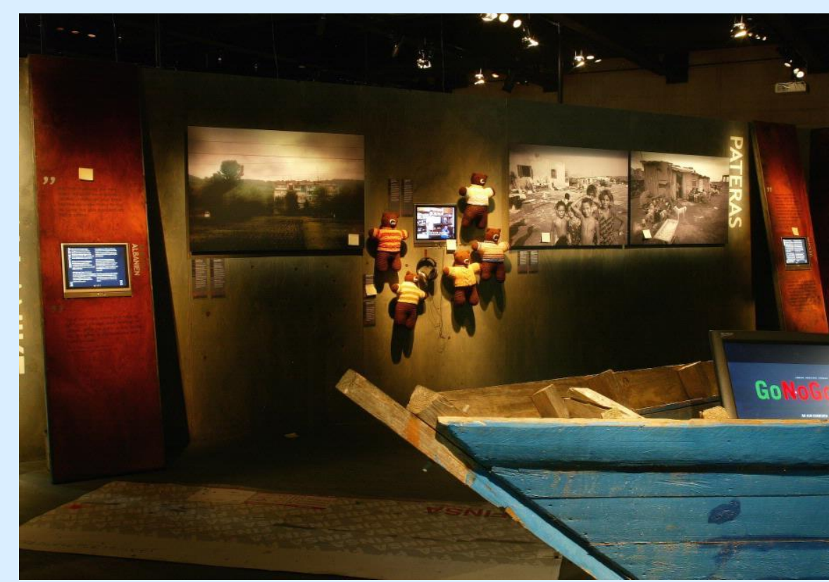
〈 스웨덴 국립세계 박물관의 'Trafficking'전 〉

'트래피킹'은 국제 무역 중에 악덕하거나 부적절한 교류를 일컫는 말이다. 국가 간의 무역 중에는 합법적인 재화의 교류도 있겠지만, 사람들을 매매하거나 문화재를 매매하는 등 어두운 부분도 도사리고 있다. 스웨덴 예테보리에 소재한 스웨덴 국립 세계 박물관의 '트래피킹'(Trafficking)'전은 최근 세계화로 인해서 사람(특히 여자나 어린이)을 사고 파는 국제 인신매매의 실태를 적나라하게 고발하여 경각심을 일으키기 위해서 기획되었다. 관람자 조사는 전시를 위해 조사를 포커스 그룹에게 보여주고 심층적인 인터뷰와 마인드맵을 통해서 의견을 모았다. 전시의 방향에 포함될 내용, 포함되지 않아야 할 내용을 전시팀에게 보고서로 전달하여 전시 기획에 반영하였다.