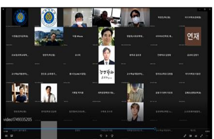
▲ 실시간 비대면 ZOOM 화면

둘 이상의 강의를 융합하여 새로운 과제를 해결하는 강의페어링의 운영 방식이 변경되었다. 2022년 2학기 학생들의 원활한 과제 수행을 위해 프로젝트에 적합한 "교수 매칭" 과정이 도입되었다.