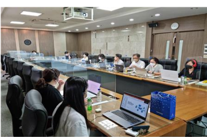
▲ 진행실 (올곡관 제 1회의실)

2주기(2022~2024) 대학혁신지원사업 및 '교육혁신 선도학과 육성사업' 설명회가 14일 실시간 비대면 ZOOM에서 개최됐다. 설명회에서는 2주기 대학혁신지원사업 자율혁신계획 및 주요 사업을 공유하고, '교육혁신 선도학과 육성사업' 운영안을 소개하는 시간을 가졌다. 이 자리에는 약 86명의 교직원들이 참석했다. 1부에서는 교육(교육평가인증센터, 교수학습개발센터), 연구, 산학협력, 기타(국제화) 영역의 주요 사업을 발표했다. 2부에서는 '교육혁신 선도학과 육성사업' 운영안을 발표했고, 질의응답 시간을 마지막으로 설명회를 마쳤다.