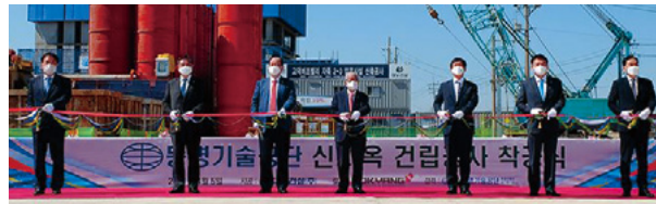
<동명기술공단 고덕비즈밸리 신사옥 착공>