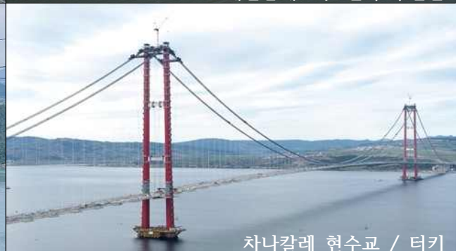
차나칼레 현수교 / 터키