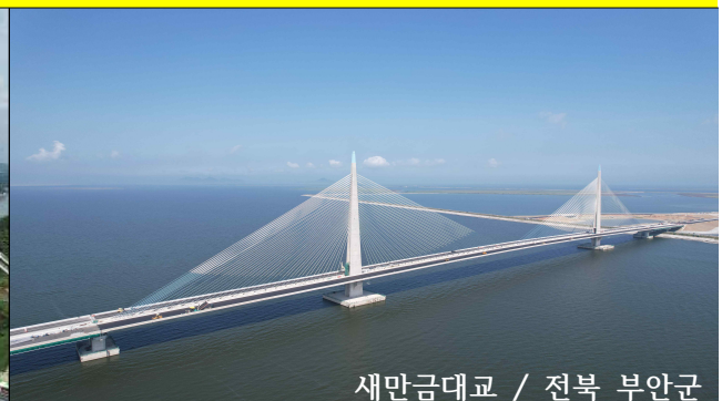
새만금대교 / 전북 부안군