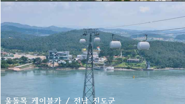
울돌목 케이블카 / 전남 진도군