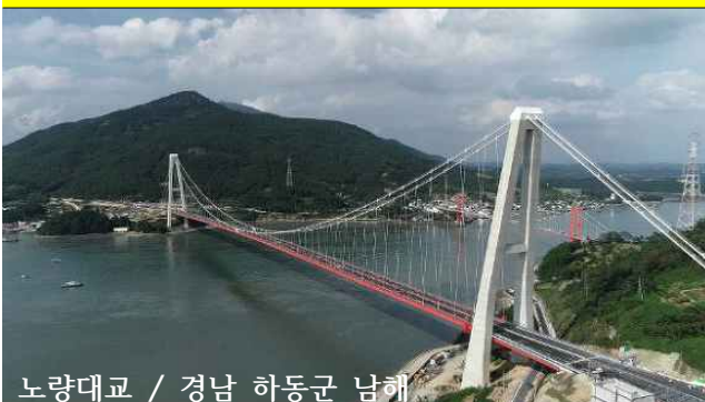
노량대교 / 경남 하동군 남해