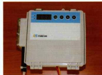
자동공급장치를 이용하여 주기적으로 자동공급