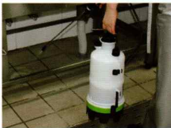
분무기를 이용하여 분사