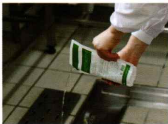
봉지를 개봉하여 직접투입