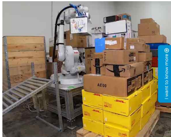
<제조용 로봇 피킹 적용사례>