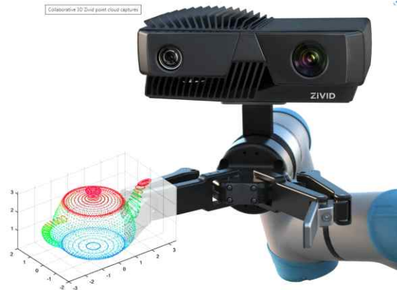
<로봇용 3D 비전을 이용한 사물인식 및 피킹포인트 생성>