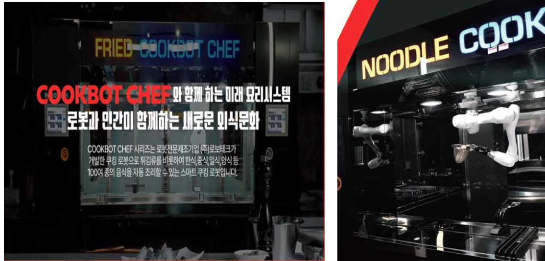
&lt;서비스 로봇 적용사례: 국수 로봇&gt;