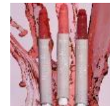
Maracuja Juicy Lip