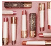
Hyaluronic Happikiss Lip