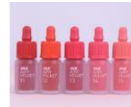
잉크 더 에어리 벨벳