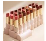
With Gratitude Dewy Lip Balm