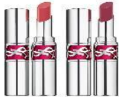
Rouge Volupte Candy Glaze Color Balm