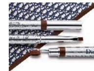
Kabuki Brow Styler